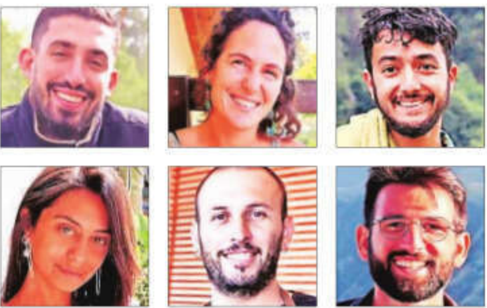
Picture shows handout images of hostages who were kidnapped by Hamas during the October 7 attacks, and whose bodies have been found in Rafah area of Gaza

The discovery stunned a public already dismayed at slow-moving efforts — shepherded by the US, Qatar and Egypt — to mediate a way to wind down the almost 11-