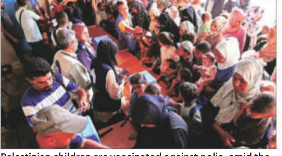
Palestinian children are vaccinated against polio, amid the Israel-Hamas conflict, in the central Gaza on Sunday

Children, escorted by members of their families, crowded a UN-run clinic in the central Gaza city of Deir Al-Balah, where