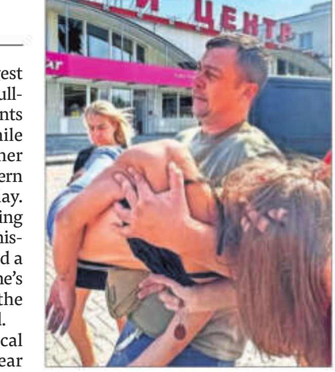
Volunteers carry a wounded local resident at site of a Russian missile strike, in Kharkiv on Sunday

It is also pressing the United States and other allies for permission to use more powerful Western-supplied weapons to inflict greater damage